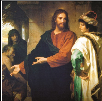
28° DOMINGO DEL TIEMPO ORDINARIO

Ellos se asombraron todavía más y comentaban entre sí: "Entonces, ¿quién puede salvarse?" Jesús mirándolos fijamente, les dijo: "Es imposible para los hombres, mas no para Dios. Para Dios todo es posible". - Mc 10, 26-27