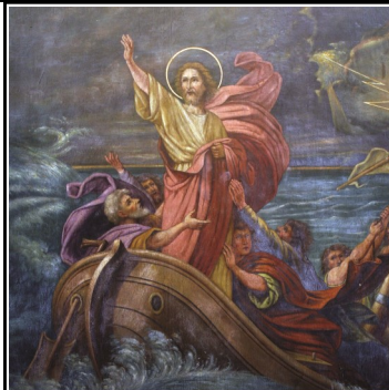
12º DOMINGO DEL TIEMPO ORDINARIO

Domingo siguiente: Sab 1, 13-15; 2, 23-24/Sal 29, 2. 4. 5-6. 11. 12. 13 [2]/2 Cor 8, 7. 9. 13-15/Mc 5, 21-43 o 5, 21-24. 35-43