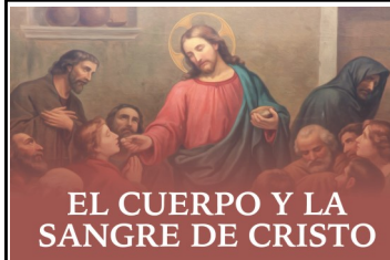
EL CUERPO Y LA SANGRE DE CRISTO

Domingo siguiente: Ez 17, 22-24/Sal 91, 2-3. 13-14. 15-16 [cfr. 2]/2 Cor 5, 6-10/Mc 4, 26-34