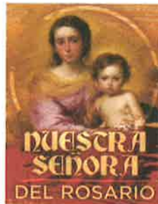
NUESTRA SEÑORA DEL ROSARIO

Entonces Jesús les dijo: "¿No han leído nunca en la Escritura: La piedra que desecharon los constructores, es ahora la piedra angular?? Por esta razón les digo que les será quitado a ustedes el Reino de Dios y se le dará a un pueblo que produzca sus frutos". - Mt 21: 42, 43