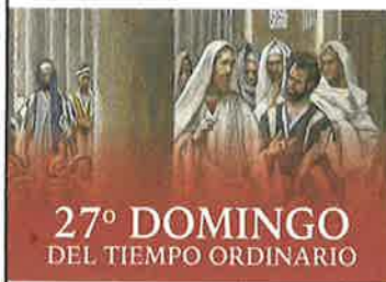
27º DOMINGO DEL TIEMPO ORDINARIO

Domingo siguiente: Is 25, 6-10/Sal 23, 1-3, 3-4, 5, 6 [6]/Flp 4, 12-14, 19-20/Mt 22, 1-14 o 22, 1-10